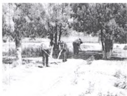
Благоустройство территории школьного двора